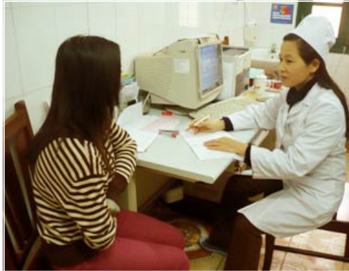
BS khám phụ khoa ban đầu thường là BS nữ (ảnh minh họa)

bạn đến với cơ sở y tế chuyên về sản phụ khoa để chữa những bệnh lây truyền qua đường tình dục, hay nạo hút thai thì điều đó cũng không liên