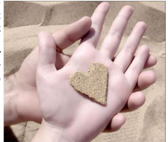
Hiểu để trân trọng nhau hơn

Anh im lặng hồi lâu rồi nói lời xin lỗi vì không hiểu sao lại gán chuyện tình dục với việc đi khám phụ khoa rồi giận giữ vô cớ. Anh nói rằng thật tốt khi tôi đã nói cho anh hiểu thay vì im lặng như mọi khi. Anh đã bị ảnh hưởng bởi những trao đổi của những người xung quanh mà quên mất đâu mới là giá trị mình theo đuổi, ai mới là người anh phải đặt niềm tin.