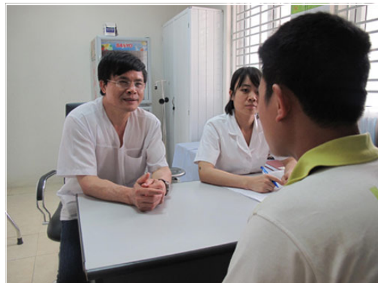
Đi khám để được nhận hỗ trợ từ bác sĩ ngay khi thấy cơ quan sinh dục nổi mụn bất thường (Ảnh minh họa; nguồn ảnh Internet)